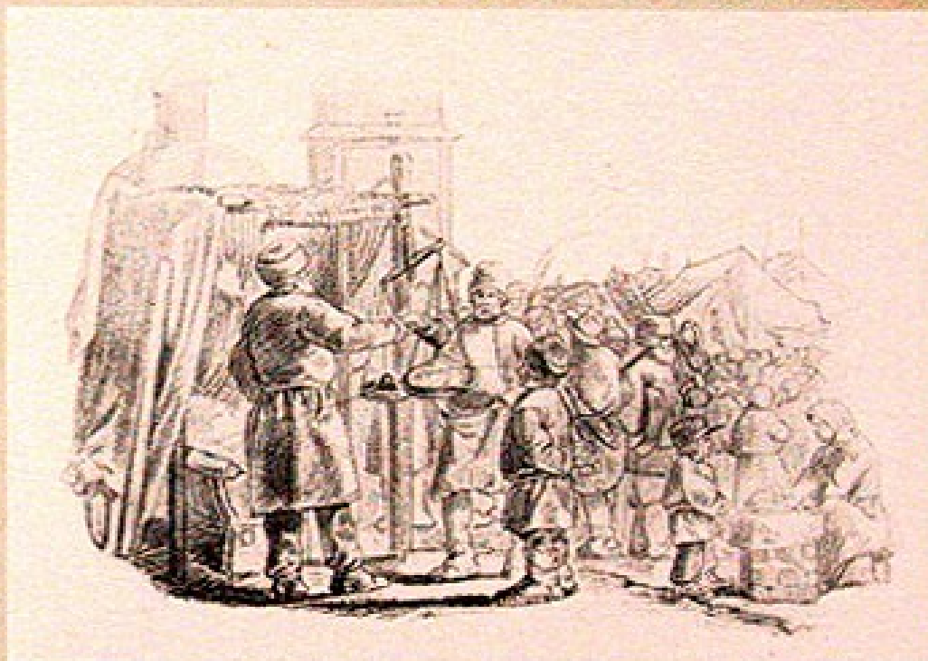
Рисунок представлял базар. Масса народа стояла у лавок и торгов. На первом плане лавка торговца, разложившего свой товар на верстак и кто-то продающая торговцу из ней кошельку. На другой стороне торговца, ожидающего продавца лавку. Вдоль выстроились ряды лавок, сдвигаясь не обозначены. Крестовидный торговца лавки.

Версиклы: «Торгуя правдою, больше барыша будешь». «Обманом барыша не наживеши».